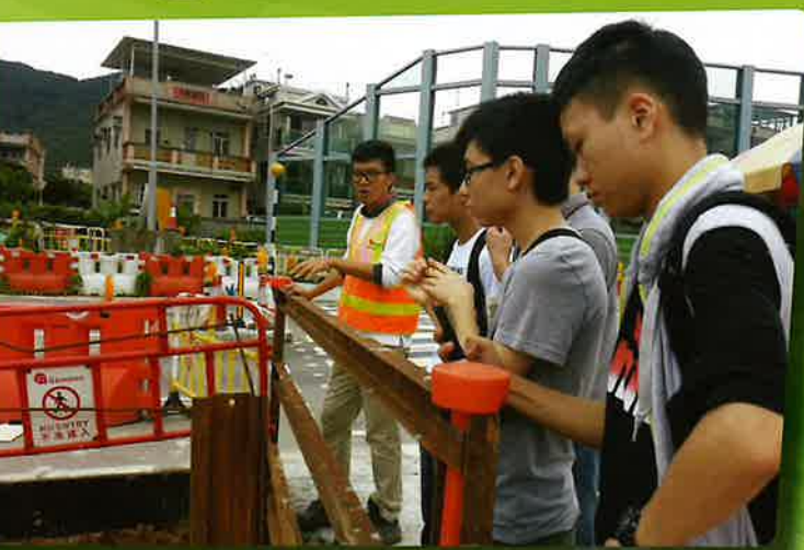
探訪廣東理文造紙有限公司