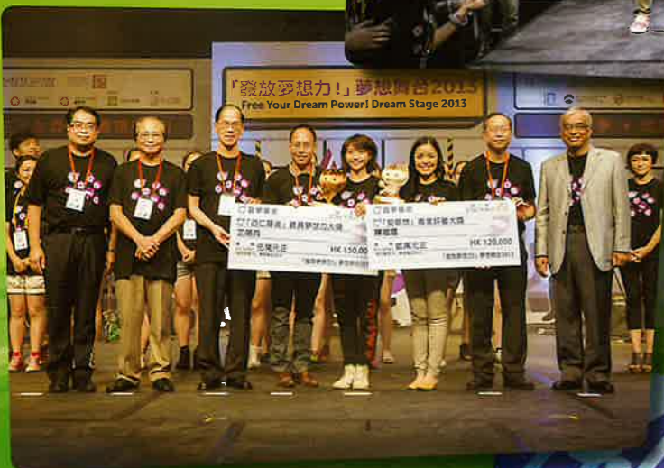
夢想舞台2013勝出隊伍與各嘉賓合照