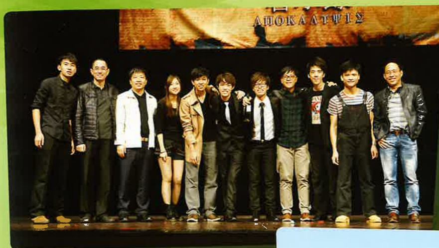
中文大學魔術學會週年表演合照

於 2013年，百仁基金推行「青年發展資助計劃」，希望投放更多資源在本港青年發展及資助有關團體舉辦青年活動。本資助計劃著重激發青年參與社區服務，將自己所學所長，回饋社會，藉以生命影響生命。其次是希望為本港青年打造一個與商界溝通的平台，成為青年與商界之間的橋樑，讓青年人認識商界，從而擴闊視野，秉承百仁精神，繼續為社會大眾服務。