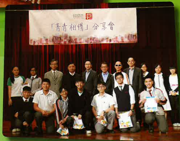
與葵錦秋中學(葵涌)師生合照