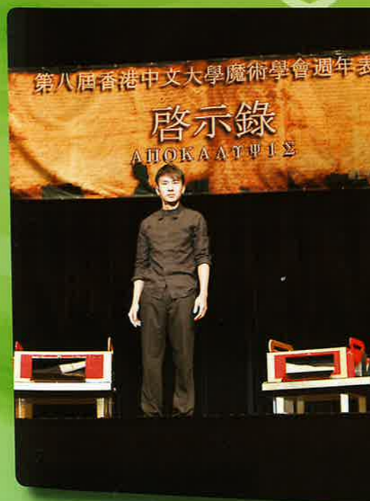
中文大學魔術學會週年表演