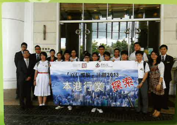
探訪偉邦物業管理有限公司