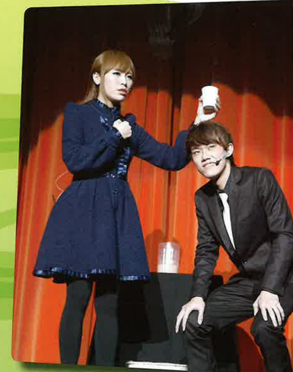
中文大學魔術學會週年表演