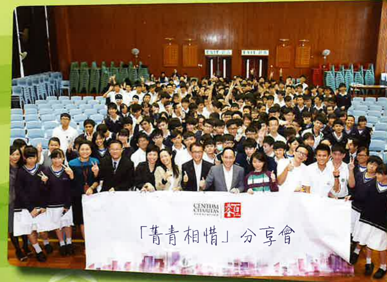
與仁濟第二中學師生合照

「菁青相惜」分享會反應熱烈，短短數月，分享會參與人數已超過3,000人次。在2014年，百仁基金將會繼續與更多中學合作，並計劃將分享會拓展至各大專院校及大學。基金希望透過旗下在香港及內地的企業，為各大專院校及大學學生提供實習機會，亦為他們到內地及海外交流考察提供資助。