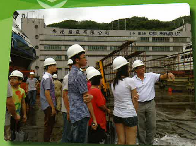
探訪香港船廠有限公司