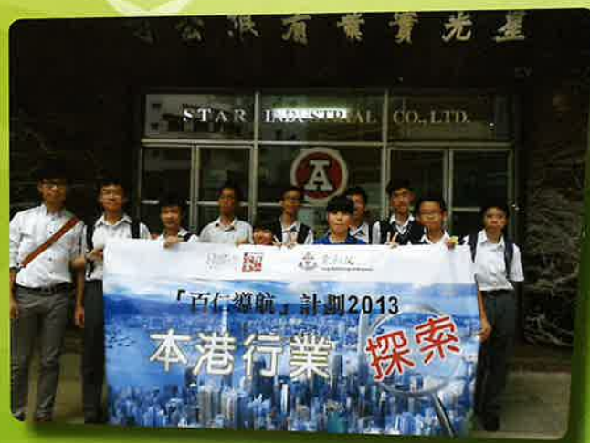
探訪星光實業有限公司