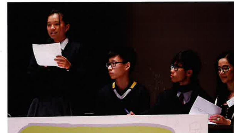
表演賽同學就議題發表立場