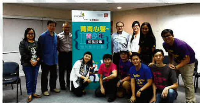
分享會嘉賓與青年人合照