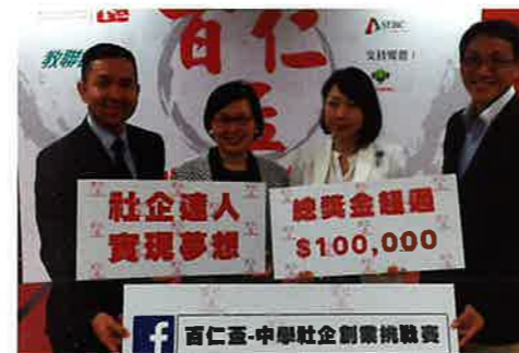
為了吸引更多學生參與，百仁盃比賽在本會九龍塘香島中學舉行了記者招待會，邀得民政事務局副局長許曉輝女士一同出席。