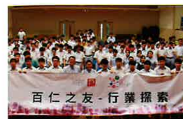
社會企業認識分享會