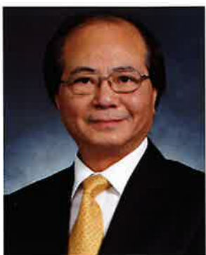
教育局局長吳克儉