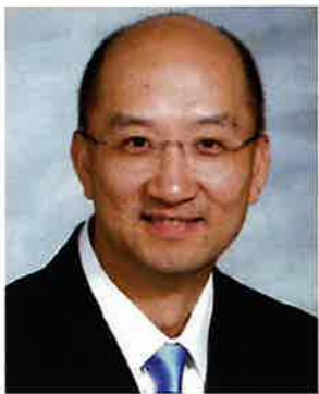
政制及內地事務局局長譚志源