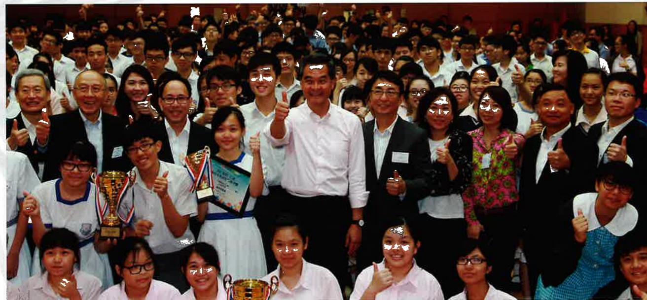
一眾嘉賓與同學近距離交流接觸