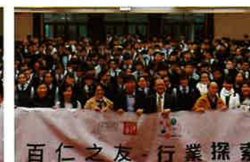
鐘錶業 (萬希泉)講座