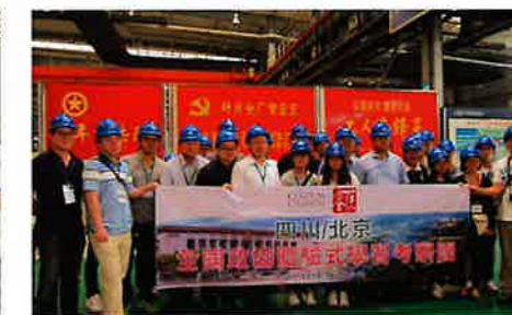
團員參觀國內企業