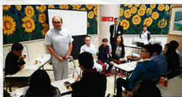
陽光護理天使到日與當地護老院舍作交流

8位「陽光護理天使」代表到了日本進行交流訪問並學習日本「介護」行業的成功經驗。祈望借鏡日本模式為本港的護理行業注入新思維。