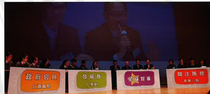
表演賽同學就議題發表立場