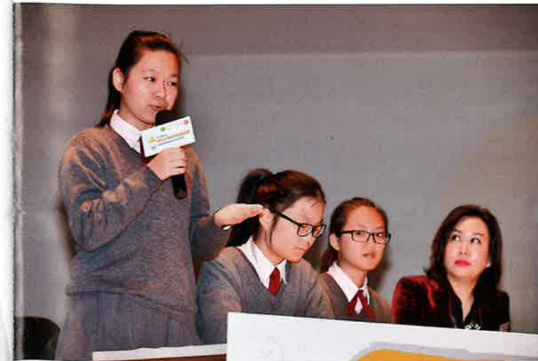
同學們能透過辯論比賽訓練多角度思考能力