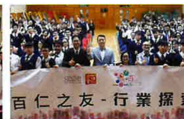
電影及藝人保姆講座