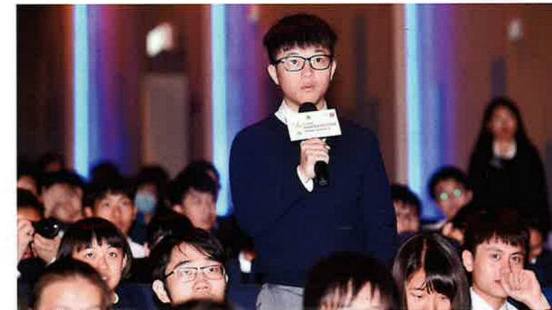
同學積極與行政長官對話