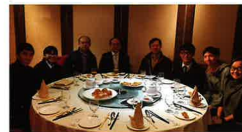
傳媒午餐上冠軍隊伍與記者分享比賽心得

最終由中華基督教會銘賢書院奪得冠軍、順德聯誼總會李兆基中學包攬亞、季軍以及最佳演說獎。頒獎典禮後，冠軍隊伍更與一眾嘉賓以及傳媒朋友一同共晉午餐，詳談他們的計劃構思、實行計劃以及分享對社會企業的感悟與認識。