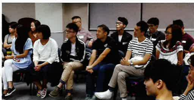
與會青年人一起聆聽分享者的故事