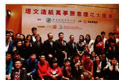
理文造紙萬事勝意煙花大匯演-義工活動