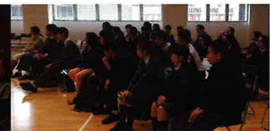
在場同學均細心聆聽簡報