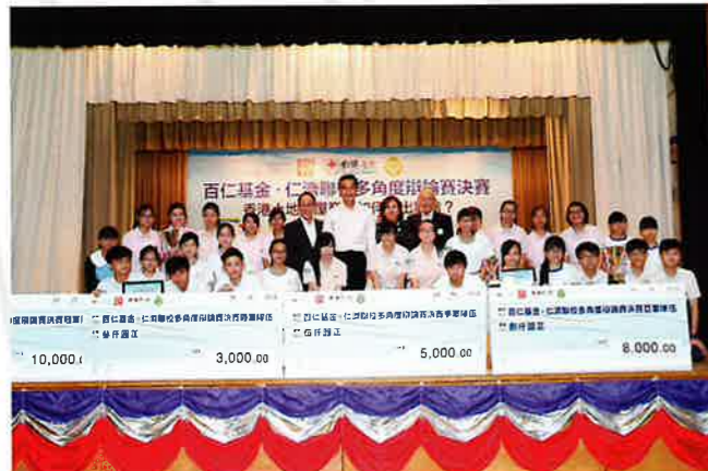
行政長官與得獎隊伍合照