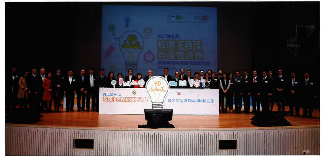
行政長官與一眾嘉賓合影