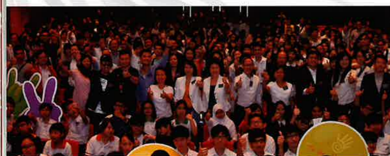
逾600位學生一同參與講座氣氛熱烈