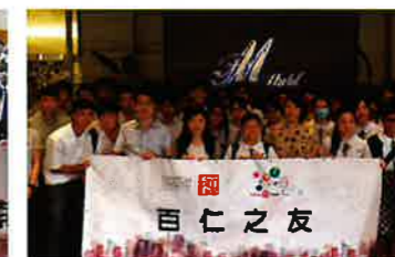
M1 Hotel 探訪