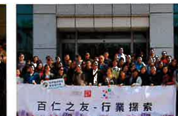
探訪廣東理文造紙有限公司 (老師團)