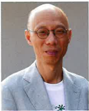
環境局局長黃錦星