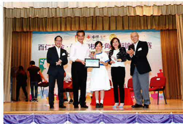
行政長官頒發最佳演說獎