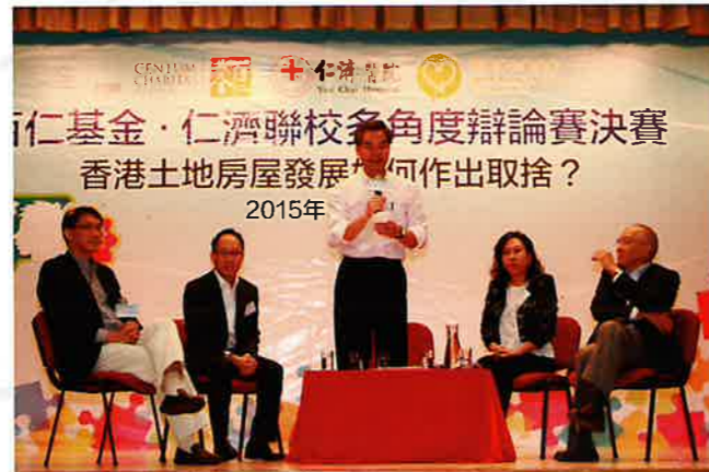
行政長官梁振英先生與參與同學就香港房屋議題對話