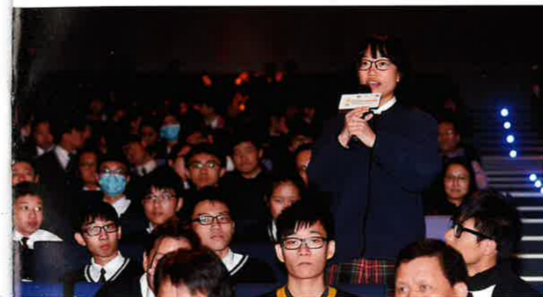
台下同學就房屋議題發表意見