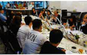
張建宗局長與陽光護理天使就香港護理業發展交流意見

此外，陽光護理天使計劃更於2015年10月向勞工及福利局張局長提交了計劃報告，總結交流成果並就護理業發展提出6大建議：