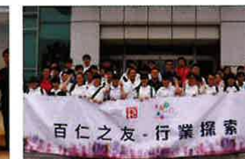
探訪廣東理文造紙有限公司 (學生團)