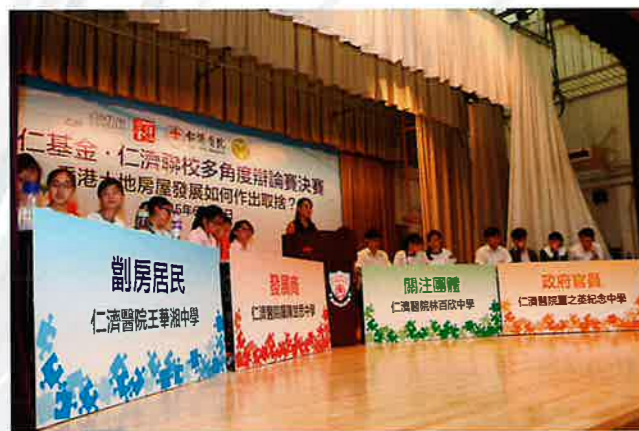
參與同學就不同立場發言以培養多角度思考

決賽則於6月24日同在仁濟醫院王華湘中學舉行，以「土地房屋－香港土地房屋發展如何作出取捨」為決賽辯題。行政長官梁振英先生擔任特別嘉賓，跟與會同學就本港房屋問題對話。當日有逾四百多名中學生觀賽，並透過網絡實時轉播到仁濟醫院轄下各間中學，逾千名同學在校一起感受比賽的激烈氣氛。最終仁濟醫院羅陳楚思中學奪得決賽冠軍，仁濟醫院林百欣中學奪得亞軍，仁濟醫院王華湘中學奪得季軍以及仁濟醫院董之英中學奪得殿軍。