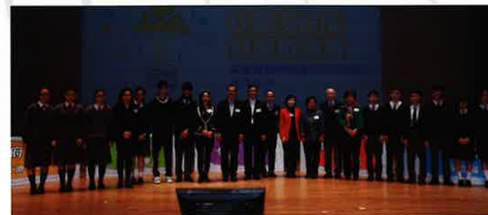
星級智囊、各團體主席與參與表演賽同學合照