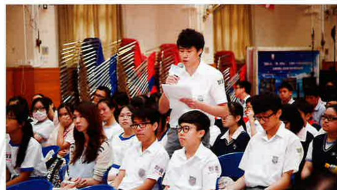
台下學生分享感想