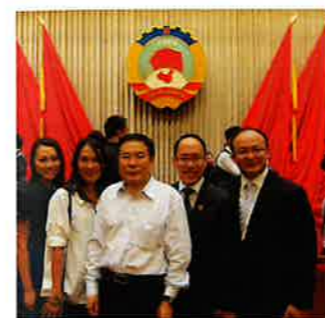
俞正聲主席勉勵把握祖國發展機遇