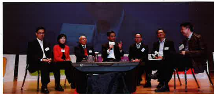
行政長官與與會嘉賓及同學對話