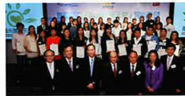
嘉許禮上嘉賓們均非常欣賞天使們的專業表現

邀請所有「陽光護理天使」及其家人友好、與僱主一同出席在香港會議展覽中心舉行的「陽光護理天使」嘉許禮，以給予這一班業界新力軍的肯定和支持。