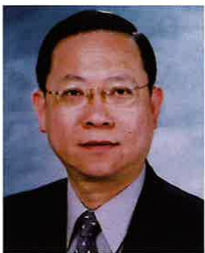
保安局局長黎棟國