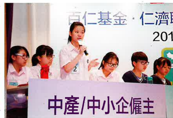
學生就不同立場發言