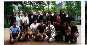
茶聚後局長與各委員及陽光護理天使合照

陽光護理天使到日本完成考察後與香港勞工及福利局局長張建宗先生進行茶聚並分享在日本交流的成果。