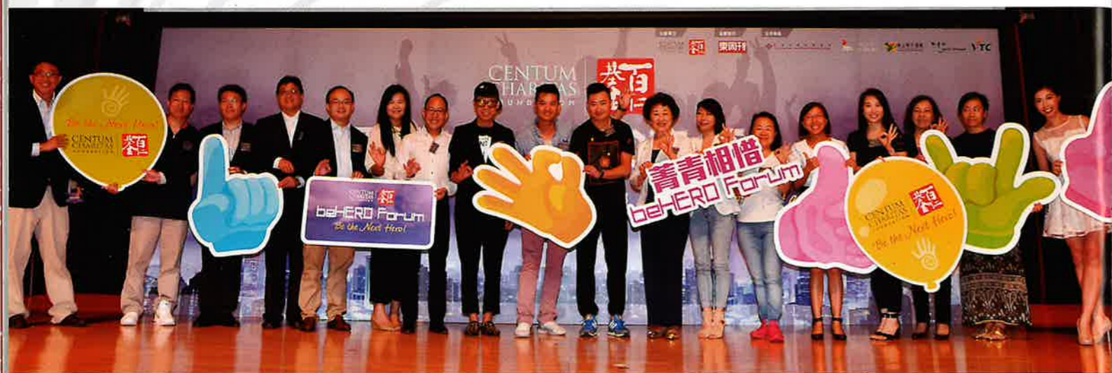
中央政策組顧問高靜芝女士與本會會員以及嘉賓合影