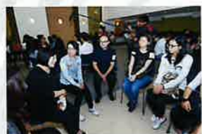
督導委員會成員向陽光護理天使分享其經驗及心得

聚結成功獲僱主推薦的青年從業員，給予他們鼓勵、促進分享交流，鞏固他們的工作目標，一同發掘服務新意念。