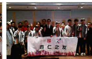
物業管理公司 (住宅) 探訪