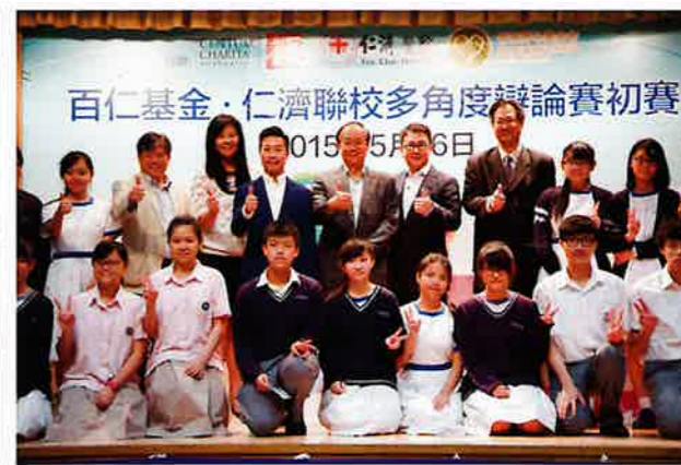
初賽評委、嘉賓與學生合影