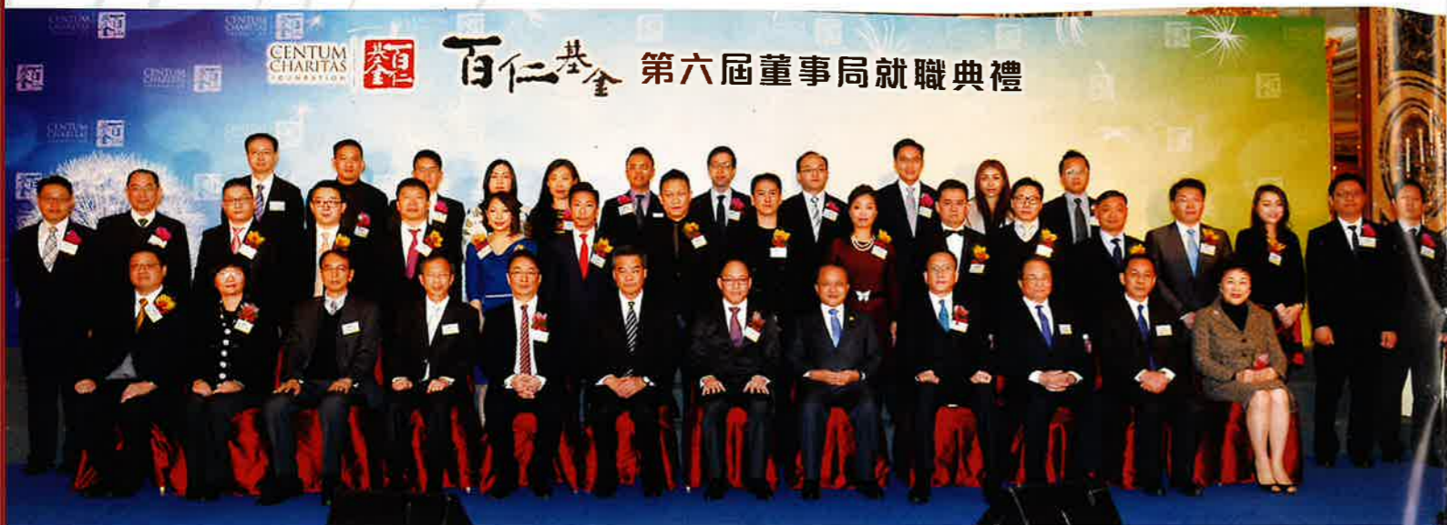
百仁基金第六屆董事局就職典禮盛況