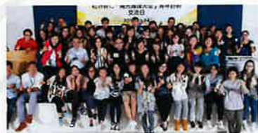
四十多位陽光護理天使以積極健康形象宣揚護理服務的新構思