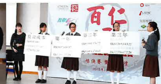
參賽隊伍簡報實況