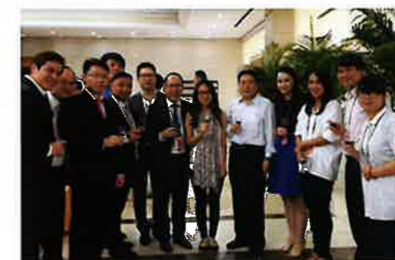
俞正聲主席與團員合影