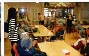
天使們與日本護老院長者參與活動